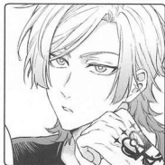
カイザー 世一の彼氏 ダイナーの常連客